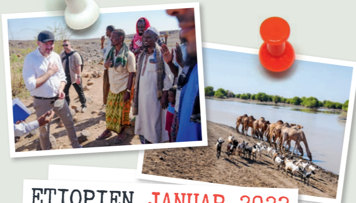
ETIOPIEN JANUAR 2023

Vi er et lille land. Men vi går forrest. Det gælder bistandspolitikken, hvor vi i årtier har givet 0,7 % af vores BNI i udviklingshjælp. I år betyder det over 20 milliarder kroner, som gør en positiv forskel ude i verden. Og det gælder klimapolitikken, hvor vi viser vejen med verdens formentlig mest ambitiøse klimamål. Og via vores effektive grønne løsninger, som hjælper den grønne omstilling på vej over hele verden.