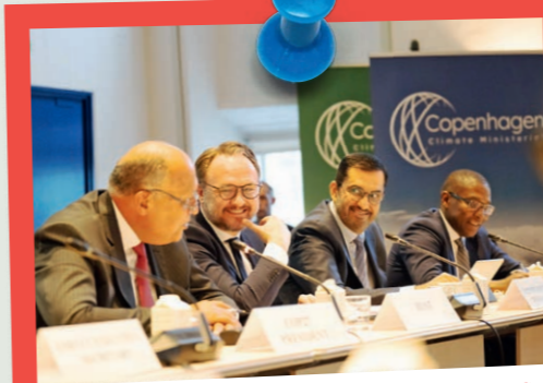
KØBENHAVN MARTS 2023