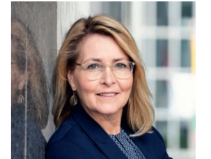
Christel Schaldemose Gruppeformand for de danske socialdemokrater i Europa-Parlamentet