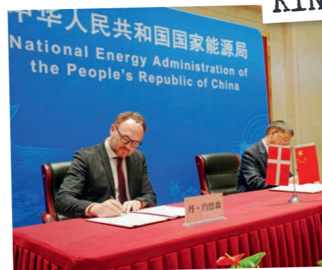
KINA APRIL 2023

Vi har etableret en Mykolaiv-styregruppe, hvor jeg sidder sammen med Ukraines vice-premierminister, guvernøren, Mykolaivs borgmester m.fl. Vi mødes jævnligt virtuelt og drøfter udviklingen og de nødvendige indsatser i byen og regionen