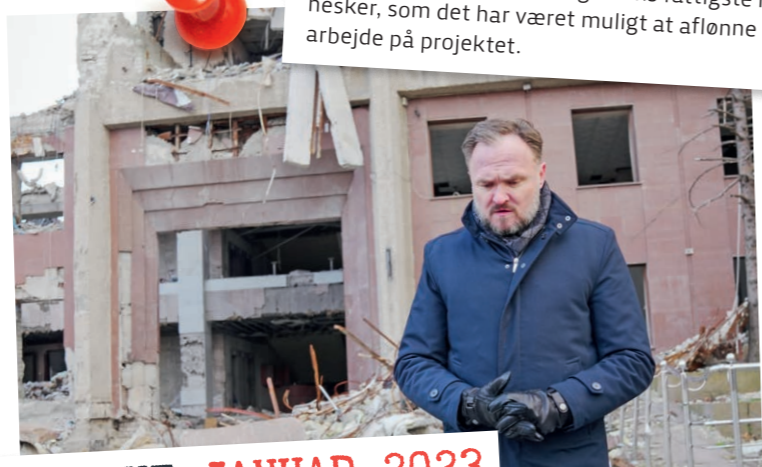
UKRAINE JANUAR 2023

Afar-regionen i Etiopien er det varmeste beboede sted på kloden. Her lever mange som nomader i en utrolig hede og med sparsom adgang til mad, vand og skygge for solen. Heden er blevet værre, tørkerne er mere hyppige og varer længere. Da jeg besøgte regionen, fortalte en lokal hyrde mig, at selv kamelerne nu er begyndt at dø af tørst. Heldigvis fik han nu hjælp. Han havde muligheden for at drive sine kameler til det vandreservoir, som Danmark har medfinansieret etableringen af. Projektet tjener et dobbelt formål. Dels at holde på vand til de særligt tørre tider, så kameler og kvæg kan overleve. Dels at beskæftige og skaffe en indkomst til nogle af regionens fattigste mennesker, som det har været muligt at aflønne for at arbejde på projektet.