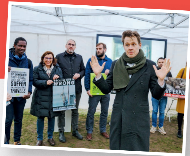
Dyrevelfærd har været en af Niels Fuglsangs mærkesager, længe før han blev valgt til Europa-Parlamentet første gang i 2019.