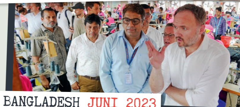
BANGLADESH JUNI 2023

På billedet sidder jeg mellem den afgående COP-formand, Egyptens udenrigsminister Sameh Shoukry, og den indkommende formand, dr. Sultan Al Jaber.