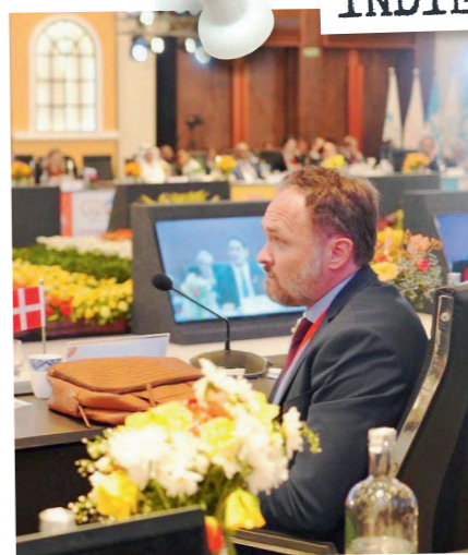
INDIEN JULI 2023

Det er også i Bangladesh, at rigtig meget af det tøj, vi går i i Danmark, bliver produceret. Det gælder blandt andet den tekstilfabrik, jeg besøgte. Under besøget indgik jeg på vegne af Danmark en aftale med Bangladesh om et nyt grønt arbejdsprogram. Et af fokusområderne er netop tekstilindustrien. Vi skal hjælpe landet med at nedbringe ressourceforbruget, forurene mindre og gøre det på en socialt bæredygtig måde.