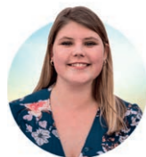
AF KATRINE EVELYN JENSEN, FORBUNDSFORMAND, DSU