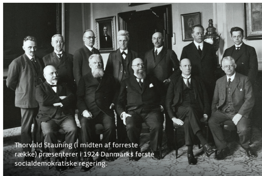
Thorvald Stauning (i midten af forreste række) præsenterer i 1924 Danmarks første socialdemokratiske regering.

– Der ligger noget i Staunings egen livsfortælling, som gør ham til en grundfortælling i arbejderbevægelsen. Han er den fattige arbejderdreng, der vokser op på samfundets dyb. Han er enormt flittig, han melder sig ind i fagbevægelsen og Socialdemokratiet, da han er 17 år gammel, og bliver den første arbejder, der bliver først minister og senere statsminister, fortæller hun.