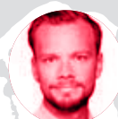
HILLERØD TIRSDAG DEN 3. MARTS Beskæftigelsesminister Peter Hummelgaard