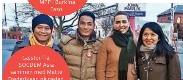
Gæster fra SOCDem Asia sammen med Mette Frederiksen på gaden i Vordingborg under kommunalvalget 2017.