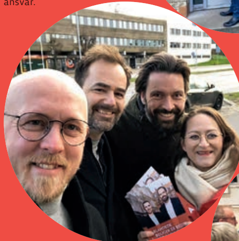
Her er vi i Nordjylland, hvor der var stort fremmøde blandt partimedlemmerne.