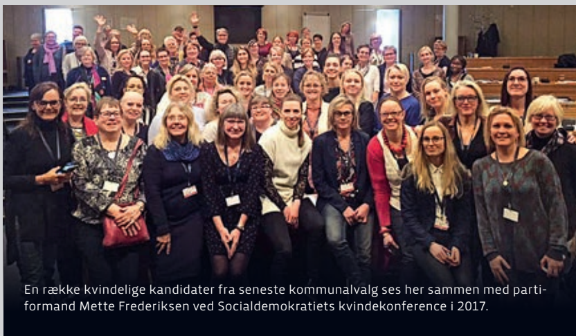
En række kvindelige kandidater fra seneste kommunalvalg ses her sammen med parti-formand Mette Frederiksen ved Socialdemokratiets kvindekonference i 2017.

»Spidskandidaten placeres som nummer ét; den øvrige liste sammensættes i forhold til resultatet af urafstemningen, således at den, der får flest stemmer, placeres som listens nummer to og så fremdeles. Dog prioriteres det, at der på alle pladser skiftevis skal være en kvinde og en mand. Dette betyder, at hvis spidskandidaten er en mand, skal den kvinde, der ved urafstemningen opnår flest stemmer, stå på 2.-pladsen og så fremdeles«.