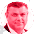
ODENSE MANDAG DEN 4. MAJ Minister for fødevarer, fiskeri, ligestilling og nordisk samarbejde Mogens Jensen