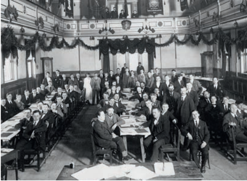
DSU blev stiftet den 8. februar 1920. Billedet her stammer fra pinsen samme år, hvor DSU holdt sin første kongres i Nyborg.

niveauer. Vores tidligere medlemmer er i dag formænd for personaleklubber, tillidsfolk på lærerværelser eller arbejdsmiljørepræsentanter på industriarbejdspladser. De tager lederskab for at skabe stærke fællesskaber og gøre en forskel der, hvor de er.