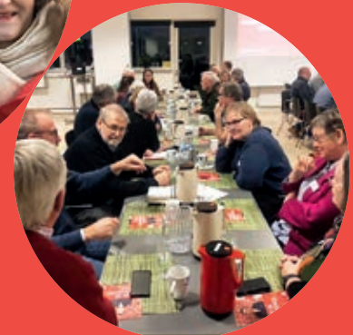
»I Vordingborg var Socialdemokratiet klar med en stand ved Vordingborgmessen. Det blev til mange gode samtaler og flere nye medlemmer.«