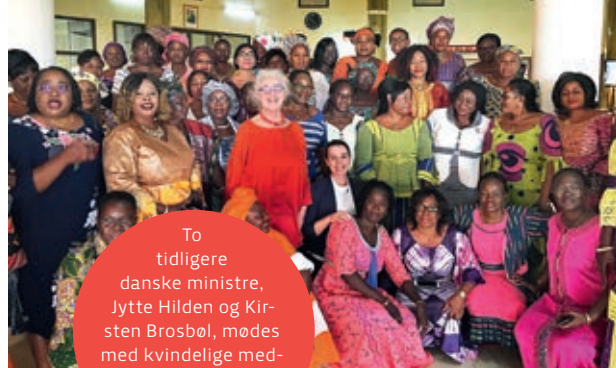
To tidligere danske ministre, Jytte Hilden og Kirsten Brosbøl, mødes med kvindelige medlemmer af partiet MPP i Burkina Faso.