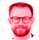
SILKEBORG MANDAG DEN 30. MARTS Transportminister Benny Engelbrecht