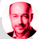
ESBJERG MANDAG DEN 16. MARTS Sundheds- og ældreminister Magnus Heunicke