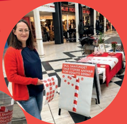
Her er det Socialdemokratiets socialordfører, Camilla Fabricius, som sammen med sin partiforening er på kampagne i hjembyen Aarhus.

Årets første måneder har også budt på en række stormøder rundt om i storkredsene. Her har hundredvis af socialdemokrater fået ny inspiration, delt viden og erfaringer og lært hinanden at kende på tværs af landet. Omdrejningspunktet har været, hvordan vi styrker Socialdemokratiet til at blive en endnu stærkere politisk bevægelse i det kommende årti. 🍷