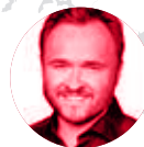
KØGE MANDAG DEN 9. MARTS Klima-, energi- og forsyningsminister Dan Jørgensen