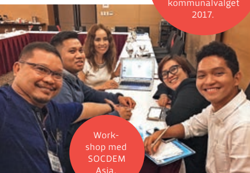
Workshop med SOCDem Asia.