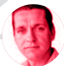
AALBORG MANDAG DEN 30. MARTS Boligminister Kaare Dybvad

Det er første gang i knap 40 år, at vi har en ren socialdemokratisk regering. Og selvom vi har masser af god politik på hyl-