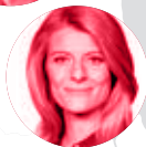
HOBRO MANDAG DEN 23. MARTS Uddannelses- og forskningsminister Ane Halsboe-Jørgensen