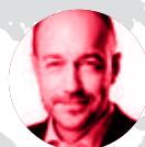
MARIBO MANDAG DEN 20. APRIL Sundheds- og ældreminister Magnus Heunicke